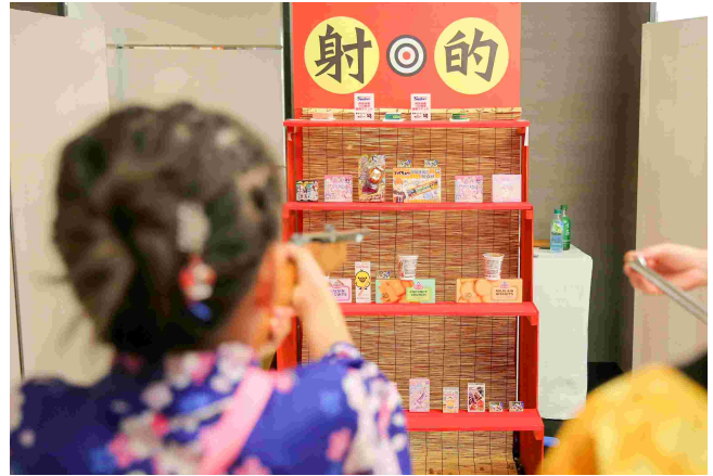
イベント/夏フェス2024