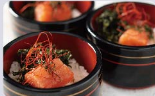
糸島市「やますえ」の 辛子明太子と福岡有明のりの 「めんたいお重」