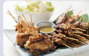
串焼き各種 (ささみしぎ焼き、鶏皮ぐるぐる巻き、 手羽先)