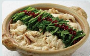
ホテル日航福岡監修 「もつ鍋」