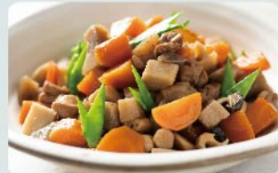
ホテル日航福岡監修 郷土料理「がめ煮」