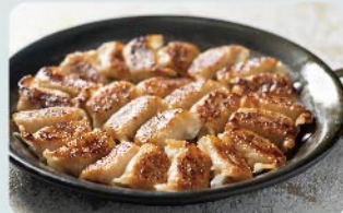
福岡名物「一口餃子」