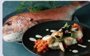
産地直送 糸島産魚介類を 使用した「本日のお魚料理」 ※入荷状況により変更となる場合がございます