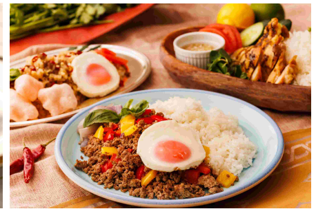
<ディナー>屋台飯 (ガパオライスなど)