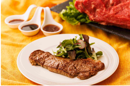
<ランチ>アンガス牛ロースのステーキ

※L=ランチ、D=ディナー ※食材の入荷状況によりメニュー内容が変わる場合がございます。