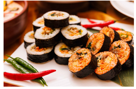
<ランチ>キンパ (韓国風海苔巻き)