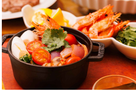
<ランチ>トムヤムクン