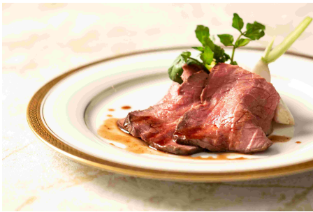
<ディナー>足柄牛のローストビーフ